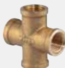
Keresztező idom - sárgaréz - Rp-menet modellszám 1632

* = Szállítás már csak a raktárkészletből