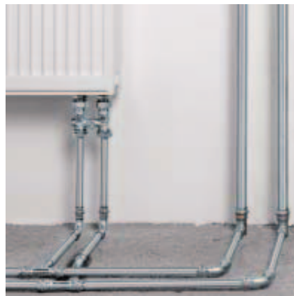
A Prestabo a sokoldalúság a fűtészterelésben.