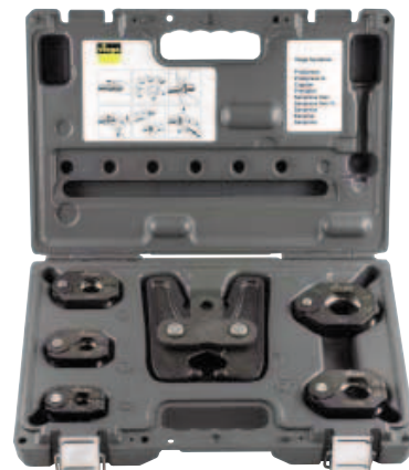
A 15 és 35 mm közötti méretekhez: csuklós présfofa szabadalmazott csuklófunkcióval és öt présgyűrű.