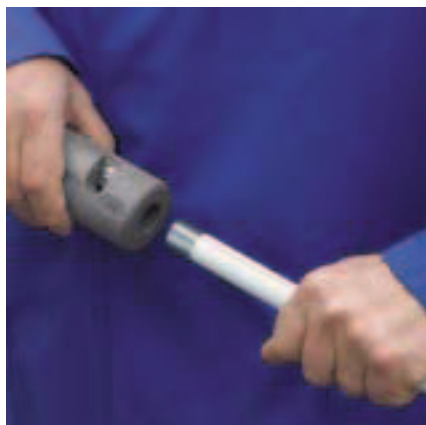
Viega hántoló szeresszám a fehér Prestabo külső csőburkolat eltávolításához.

A Viega a Prestabo szereléséhez maximális komfortot és nagyfokú biztonságot szavatoló munkaeszközöket fejlesztett ki. A hántoló szeresszámmal a csövek fehér polipropilén burkolatát távolíthatja el falon kívüli szereléshez. A Viega prészerszámokkal pedig másodpercek alatt biztos kötésekét létesíthet.