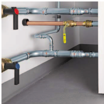
Kazánbekötés: Előre- és visszatérő vezeték Prestabo rendszerrel és Easytop gömbcsapokkal. Gázbekötés Profipress G rendszerrel.